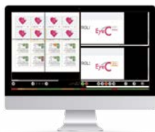
EyeC Profiler Content