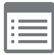
Audit Trail Viewer