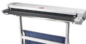
EyeC Profiler 900 - 1100 CS