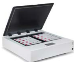
EyeC Profiler 400 - 600 DT