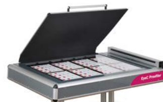
EyeC Profiler 900 - 1200 DT