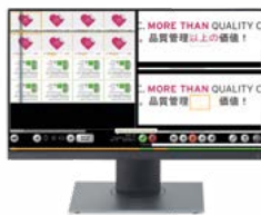
EyeC Profiler Graphic

Interessiert? Mehr über unsere Produkte: